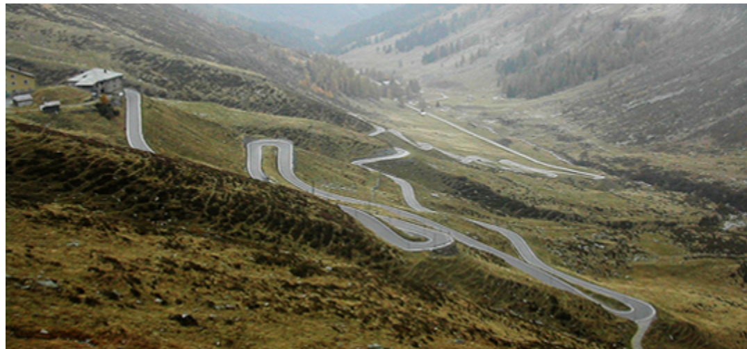
Abbildung 4: Blick auf die Splügenpassestrasse

Sustenpass ( BE 15.8 ): Verschiedene Stellen an der Sustenstrasse wurden in den vergangenen Jahren instand gesetzt, die meisten auf der Urnerseite. Um den denkmalpflegerischen Aspekten der Sustenpassestrasse gerecht zu werden, hat der Kanton Bern (auch mit Unterstützung des ASTRA) eigens einen Richtplan erstellen lassen. Im Richtplan Sustenpass hat der Kanton Bern „die gestalterische und denkmalpflegerische Qualitätssicherung beim Betriebs- und/oder Erneuerungserhalt der Sustenstrasse“ festgehalten. Ob bei Planungen, Baugesuchen oder im Unterhalt: Der Richtplan soll als Arbeitsinstrument dazu dienen, die historischen Passestrasse über den Susten integral zu erhalten. Verschiedene Massnahmenblätter beschreiben einzelne Aspekte detaillierter, z.B. das Normalprofil oder die Erhaltung von Einzelobjekten (wie Tunnels oder Schutzbauten vor Naturgefahren).