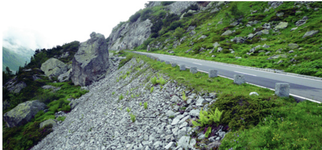
Abbildung 5: Sustenpassestrasse mit Randsteinen und Rollierung

Sustenpass ( BE 15.8 ): Verschiedene Stellen an der Sustenstrasse wurden in den vergangenen Jahren instand gesetzt, die meisten auf der Urnerseite. Um den denkmalpflegerischen Aspekten der Sustenpassestrasse gerecht zu werden, hat der Kanton Bern (auch mit Unterstützung des ASTRA) eigens einen Richtplan erstellen lassen. Im Richtplan Sustenpass hat der Kanton Bern „die gestalterische und denkmalpflegerische Qualitätssicherung beim Betriebs- und/oder Erneuerungserhalt der Sustenstrasse“ festgehalten. Ob bei Planungen, Baugesuchen oder im Unterhalt: Der Richtplan soll als Arbeitsinstrument dazu dienen, die historischen Passestrasse über den Susten integral zu erhalten. Verschiedene Massnahmenblätter beschreiben einzelne Aspekte detaillierter, z.B. das Normalprofil oder die Erhaltung von Einzelobjekten (wie Tunnels oder Schutzbauten vor Naturgefahren).