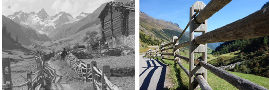
Abbildungen 1 und 2: Meientaler Holzzäune früher und heute

Auf Initiative von Pro Natura werden die Holzzäune auf einer Länge von rund 1.3 km wieder neu aufgebaut oder instand gestellt. Verwendet wird hierfür einheimisches Lärchen- und Fichtenholz, verarbeitet von lokalen Sägereibetrieben. Für die gesamte Sanierung werden ungefähr 360 Lärchenpfosten und fast 1'500 Holzlatten aus Fichtenholz gebraucht – die Gesamtlänge des Materials beträgt rund 5'250 Meter. Die Pfosten der Holzzäune sind jeweils 4-lochig. Mit einem Fonds soll der Unterhalt der Holzzäune längerfristig sichergestellt werden.