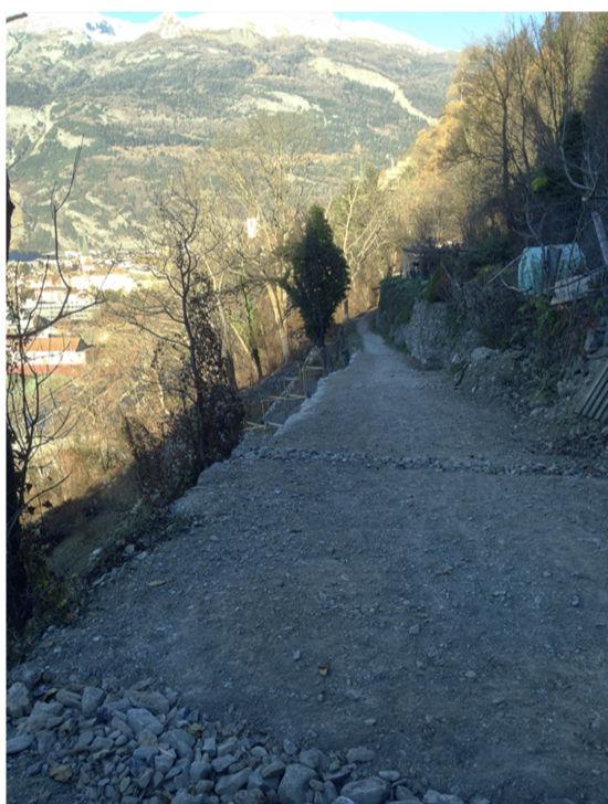
Ill. 3 : Les murs de soutien remis en état, vus d'en haut