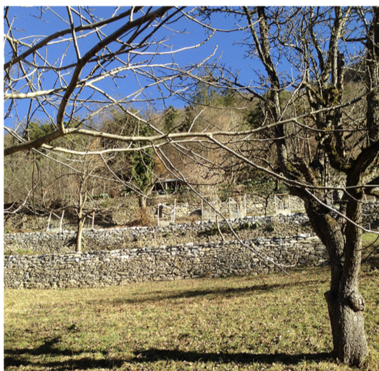
Ill. 1: Paysage en terrasses à Seidengut