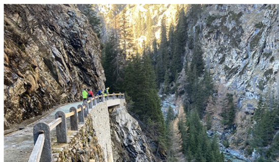
Vecchia strada di Avers smontata a Starlera. Fondamenta e consolidamento del pendio per la realizzazione del nuovo muro di sostegno.

La "vecchia strada di Avers" del Cantone dei Grigioni, risalente agli anni 1890-1895, collega Juf e la Gola della Roffla nei pressi di Andeer. Affascinanti ponti e mura in pietra naturale, balaustrate con colonne di pietra naturale e tradizionali ripari antivalanghe rendono la via un bene culturale straordinario. Nel 2020 è stato ricostruito a Starlera il muro di sostegno crollato e a Pian Davains è stato realizzato l'ultimo tratto della passerella pedonale lungo la strada cantonale (v. fotografie). Queste due opere hanno rappresentato una nuova pietra miliare per Avers. La valle ora risulta infatti percorribile completamente con un sentiero proprio, separato dalla strada principale.