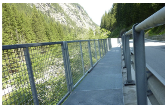
Nuova passerella pedonale che costeggia la strada cantonale. Con l'opera si sono chiuse le ultime lacune di rete e il sentiero è ora completamente percorribile senza interferenze con la strada cantonale.

Con gli interventi di riparazione sulla strada di Avers, si è contribuito a conservare per il pubblico un frammento quasi perso della storia delle vie di comunicazione. Inoltre, permette nuovamente escursioni su lunghe tratte in una valle con straordinarie caratteristiche paesaggistiche. Per il Servizio IVS è sempre bello quando si possono realizzare progetti come quello della strada di Avers, con i numerosi elementi di particolare pregio a livello culturale e di protezione dei monumenti storici.