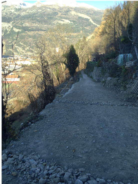
Immagine 3: Muri di sostegno ripristinati, visti da sopra