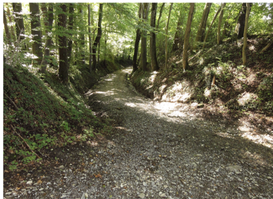
Immagine 4: Esempio di una strada incassata ben integrata nel paesaggio presso Meilen

Chi voglia ripristinare a regola d'arte una via di comunicazione storica deve quindi porre particolare accento sulla preservazione della larghezza e del tracciato storico. In caso contrario la via storica non è conservata in maniera intatta. In caso di dubbio vale la pena di discutere anticipatamente il progetto e la domanda di finanziamento con l'USTRA.