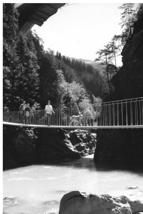
Fig.2 Conçu par Jürg Konzett à la fin des années 90, le Punt da Suransuns, dans la Via Mala, frappe à la fois par sa simplicité et son élégance.

nous avons invoqués en faveur de la variante retenue. En effet, il se pourrait qu'un jour nos décisions soient examinées d'un œil critique. Le principe qui s'est imposé au cours de ces dernières décennies en matière de sauvegarde du patrimoine culturel consiste à conserver au maximum la substance d'un ouvrage en le réparant et à ne reconstituer qu'exceptionnellement les éléments perdus ou ceux qui sont dans un état de délabrement avancé. Pour leur part, les adaptations aux formes actuelles d'utilisation requièrent, sur le plan de la technique et de l'aménagement, des interventions conformes au savoir-faire d'aujourd'hui. Citons à titre d'exemple le chemin de la Via Mala, où l'ancienne voie a été complétée par des ouvrages modernes de très haute qualité. Cette formule confère un grand attrait à cet itinéraire et offre au randonneur une vision culturelle ouverte qui contribue à son tour à sensibiliser le public à la sauvegarde d'un patrimoine d'une grande richesse.