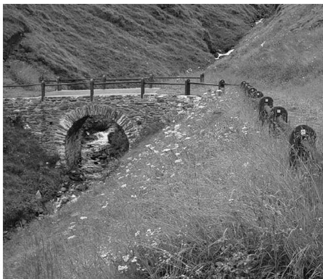
Fig.1 Un virage coupé de l'ancienne route d'Avers (Alte Averser- strasse) à l'ouest de Cresta (GR) Photo: Fredi Bieri, IVS (2004)

Les questions pécuniaires ne doivent cependant pas faire oublier le thème proprement dit, à savoir les voies de communication historiques sont les témoins des déplacements et du commerce d'époques révolues. La fascination qu'exercent ces témoins de pierre mérite une large place dans le document que vous avez sous les yeux. Notre choix s'est porté sur l'ancien chemin d'Avers dans le canton des Grisons.