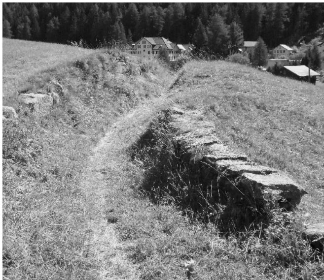
Fig. 1 Ancienne route de vallée Hospental (UR)

Le projet d'ordonnance se compose du texte d'ordonnance (texte légal) et de l'annexe qui comprend l'inventaire proprement dit. Ce dernier comprend la liste des itinéraires, les cartes d'inventaire et de terrain ainsi que les descriptifs illustrés des objets d'importance nationale. Les cartes d'inventaire ont été transférées dans un système d'information géographique (SIG) et sont publiées sur Internet. Afin de simplifier la procédure de consultation, les participants à l'audition peuvent, grâce à l'application SIG, soumettre directement leurs prises de position concernant le projet d'inventaire sur Internet. La procédure d'audition se déroulera presque entièrement par la voie électronique. La plateforme électronique n'est pas uniquement un instrument efficace pour l'audition mais elle invite aussi le lecteur de partir à la découverte des voies de communication.