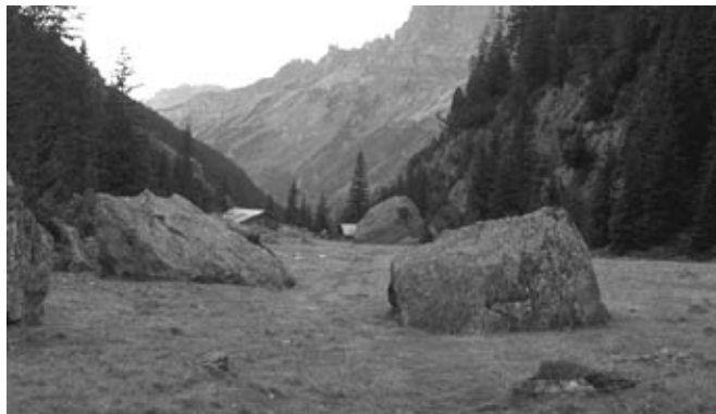
Fig. 1 : L'alpe Wyssenmad au Col du Susten

A moyen terme, c'est sur les travaux législatifs que vont se concentrer les efforts. Soumis aux services fédéraux et aux commissions techniques nationales intéressés dans le cadre d'une procédure interne en automne dernier, le projet d'ordonnance concernant la protection des voies de communication historiques de la Suisse (OIVS) sera mis en consultation auprès des cantons et des autres milieux concernés (voir l'article spécifique publié dans le présent bulletin). La transformation minutieuse et coûteuse des données disponibles de l'inventaire pour en permettre une diffusion informatisée simple fait également partie de ce travail.